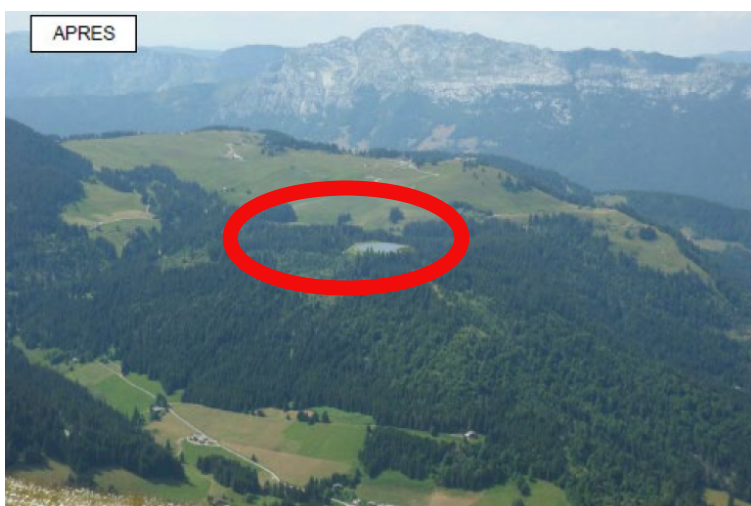
Insertion paysagère depuis le sommet du téléski de l'Etale

La retenue s'implante dans un milieu naturel préservé, au milieu d'un couvert forestier accessible seulement par des pistes. Son emprise est de 3,8 hectares avec une digue de 12 mètres de hauteur.